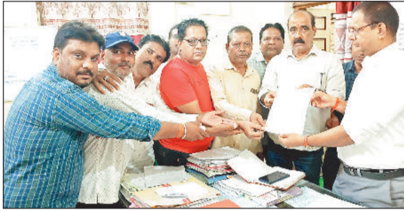
हस्ताक्षर से तैयार ज्ञापन सौंपा