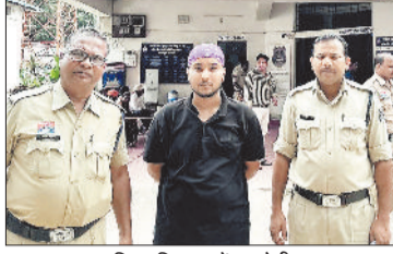
पुलिस गिरफ्तार में आरोपी।

थाना कुनकुरी क्षेत्र की एक युवती ने 18 जुलाई 2022 को रिपोर्ट दर्ज कराई थी, कि सोशल मीडिया साइट इंस्टाग्राम के माध्यम से