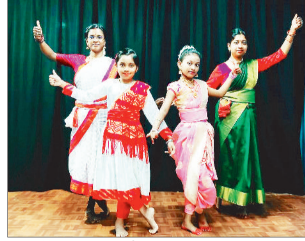
समापन मौके पर नृत्य प्रस्तुत करती छात्राएं।

जशपुरनगर। छत्तीसगढ़िया क्लाउड अ सोशियो कल्चरल ऑर्गेनाइजेशन के द्वारा नगर में 20 दिवसीय भरतनाट्यम नृत्य कार्यशाला का आयोजन किया गया। कार्यशाला में प्रतिभागियों ने पंजीन करकर 20 दिनों तक गहन प्रशिक्षण प्राप्त किया। कार्यशाला में छात्रों को शास्त्रीय नृत्य की मुद्राओं, आसन, भाव आदि का प्रशिक्षण दिया गया साथ ही समापन के अवसर पर प्रस्तुति का आयोजन भी किया जिसमें प्रशिक्षणार्थियों और प्रशिक्षक दोनों ने मिलकर भरतनाट्यम नृत्य पर आधारित प्रस्तुति दी। प्रशिक्षण में मुख्य रूप से शास्त्रीय नृत्य के सही गतियों, भाव, आसन और मुद्राओं को बतलाया गया। गोस्वामी तुलसीदास जी द्वारा रचित 'श्री रामचंद्र कुपालु भज मन' भजन पर सभी ने मनमोहक प्रस्तुति दी, भरतनाट्यम में दक्षिण भारतीय पदों के गायन के साथ ही नृत्य की प्रस्तुति होती है पर शुरु में थोड़ा कठिन है होती है, इसी कारण से राम भजन पर नृत्य की प्रस्तुति हुई।