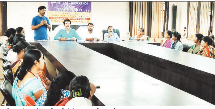
कार्यशाला में नया के पदाधिकारियों के साथ उपस्थित महिलाएं।