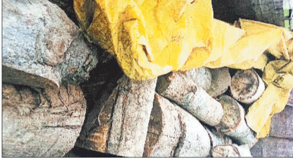
ट्रक में लोड लकड़ी।

वनमण्डलाधिकारी से मिली जानकारी के अनुसार परिक्षेत्राधिकारी मनोरा द्वारा मनोरा परिक्षेत्र के परिसर ओरडीह के निरीक्षण के दौरान ग्राम तलोरा के पास टाटा ट्रक वाहन क्रमांक सीजी 15 सीडब्ल्यू 37911 से सेमल लकड़ी लोड देखकर संदेह के आधार पर पूछताछ किया गया।